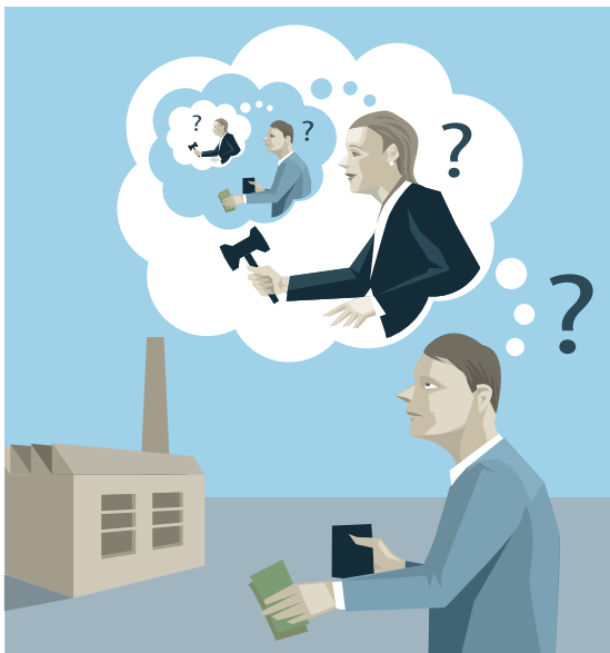
En investerare grundar sitt beslut på förväntningar om framtida ekonomisk politik.

En svårighet när det gäller att förstå hur ekonomin fungerar är att sambanden oftast är dubbelriktade. Är det politiken som påverkar den ekonomiska utvecklingen eller är orsakssambandet det motsatta? Ett skäl till denna tvetydighet är att både privata och offentliga aktörer aktivt blickar framåt: den privata sektorns förväntningar om framtida politik påverkar dagens beslut om till exempel löner, priser och investeringar, samtidigt som de ekonomisk-politiska besluten styrs av förväntningar om utvecklingen i den privata sektorn.