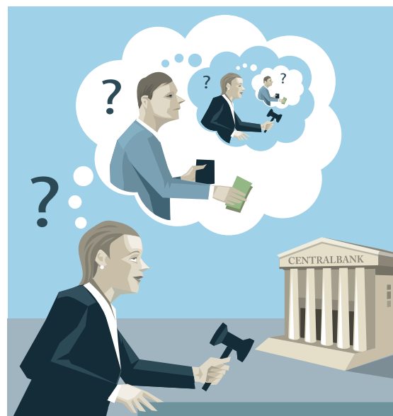
Centralbankens räntebeslut beror på förväntningar om utvecklingen inom den privata sektorn.