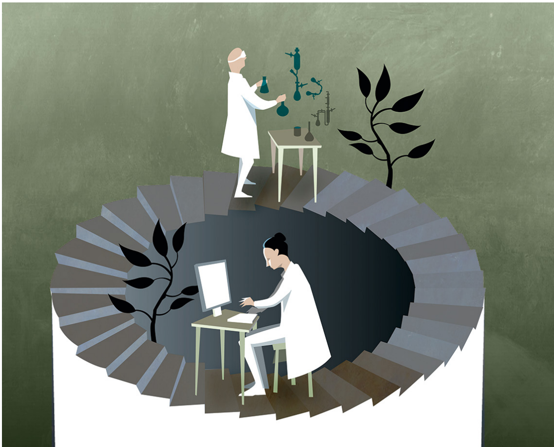
Bild 1. Idag experimenterar kemister lika mycket i sina datorer som i laboratoriet. Datorernas teoretiska resultat bekräftas genom verkliga experiment som kan ge nya ledtrådar till hur atomvärlden fungerar. Teori och praktik korsbefruktar på så vis varandra.

För att du som läsare ska få en uppfattning om vilken nytta mänskligheten kan ha av detta, ska vi börja med ett exempel. Du ska få ta på dig en labbrock och anta en utmaning: att skapa konstgjord fotosyntes. Den kemiska reaktion som sker i blommors gröna blad, fyller atmosfären med syre och är en grund för liv på jorden. Men den är också intressant ur ett miljötekniskt perspektiv. Kan du härma den, skulle du kunna effektivisera solceller. När vattenmolekyler spjälkas bildas, förutom syre, även väte som skulle kunna driva våra bilar. Det finns alltså anledning för dig att engagera dig i detta projekt. Lyckas du, kan du bidra till att lösa problemen med växthuseffekten.