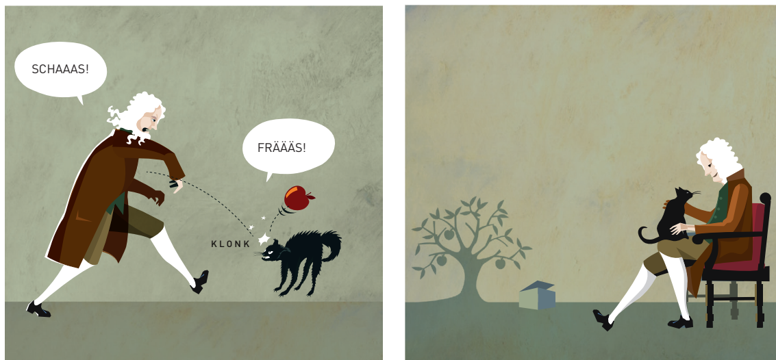
Bild 2. Newton och Schrödingers katt. Tidigare var den klassiska fysiken och kvantkemin två rivaliserande världar. 2013 års Nobelpristagare i kemi har öppnat en dörr mellan dem och fått till ett fruktbart samarbete.

Det första steget mot detta samarbete togs i början av 1970-talet på Martin Karplus laboratorium vid Harvarduniversitetet i Cambridge, USA. Martin Karplus var djupt rotad i kvantvärlden. Hans forskargrupp tog fram datorprogram som med hjälp av kvantfysik simulerade kemiska reaktioner. Under sin karriär hade han också utvecklat den så kallade Karplusekvationen som används inom kärnmagnetisk resonans (NMR); en metod som är välkänd bland kemister och som bygger på molekylers kvantkemiska egenskaper.